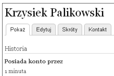
Rysunek 5.1. Strona użytkownika w systemie Drupal